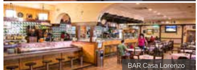
BAR Casa Lorenzo